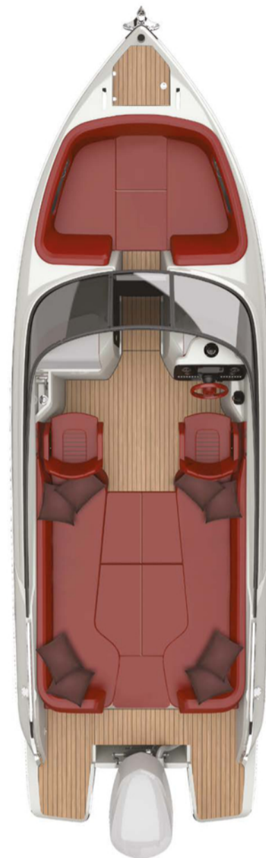
MAIN DECK SUNBED