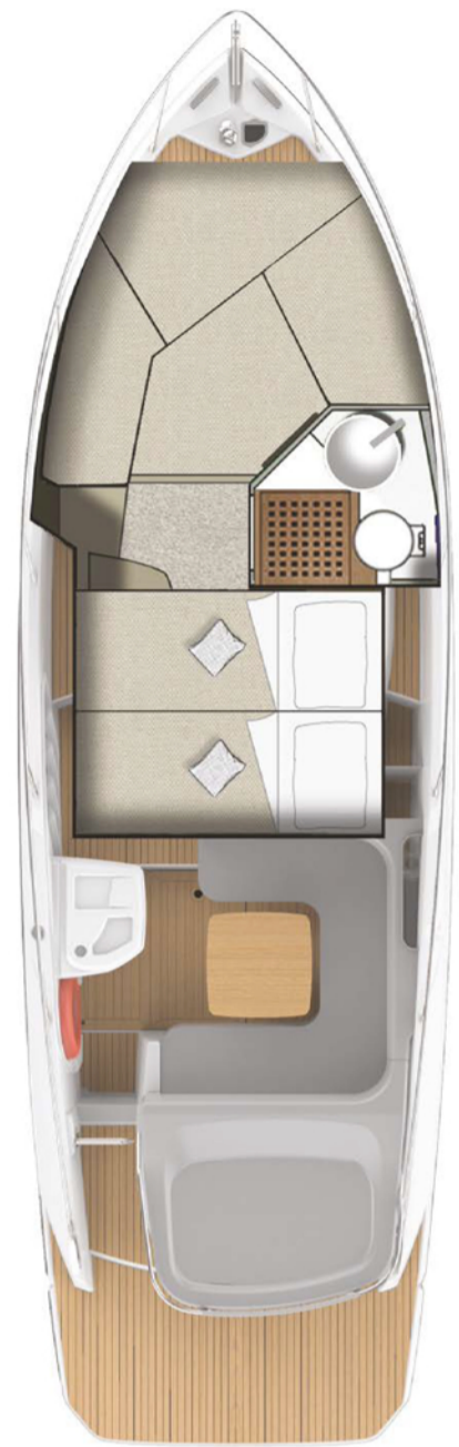
LOWER DECK BED